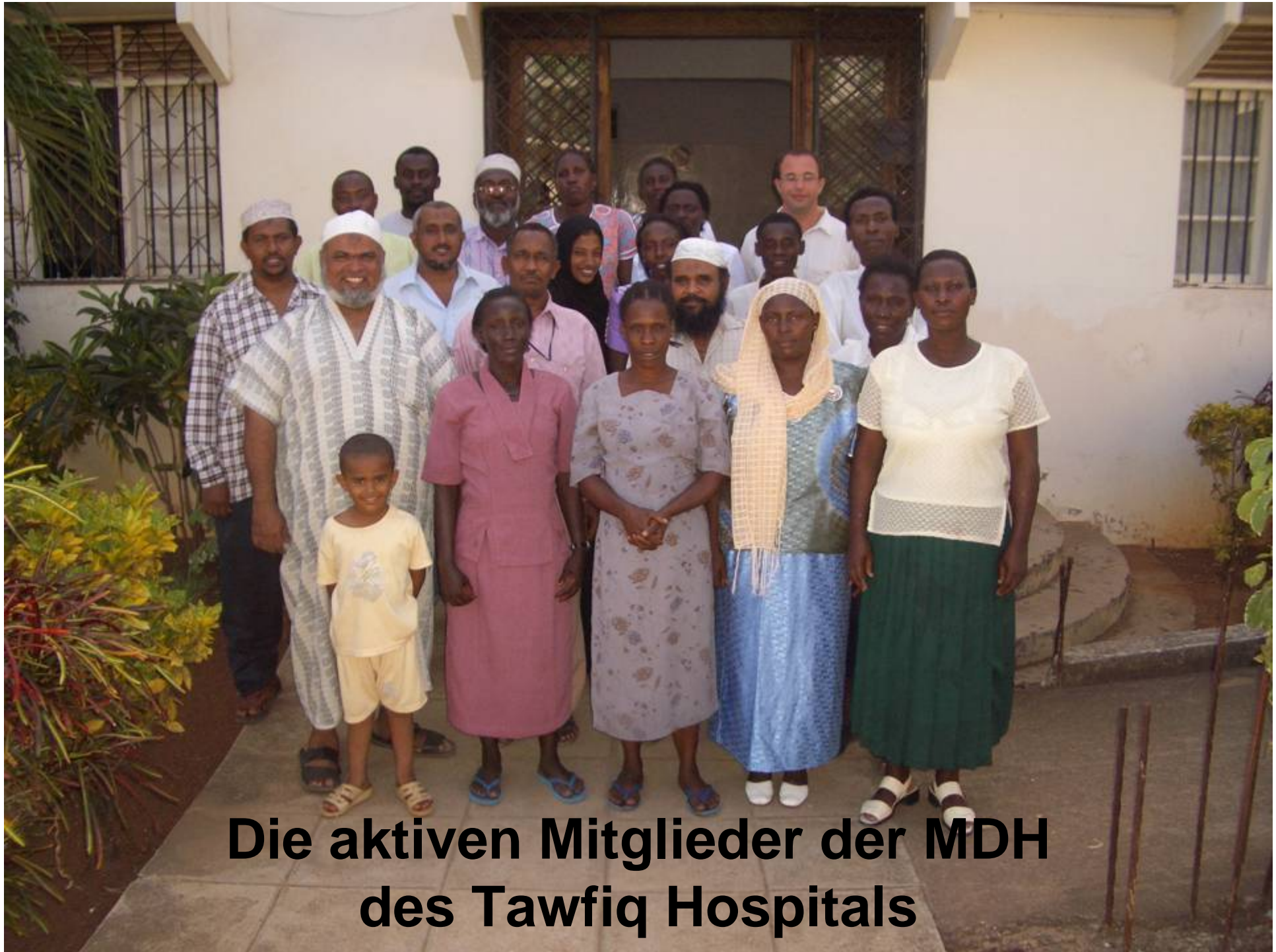
Die aktiven Mitglieder der MDH des Tawfiq Hospitals