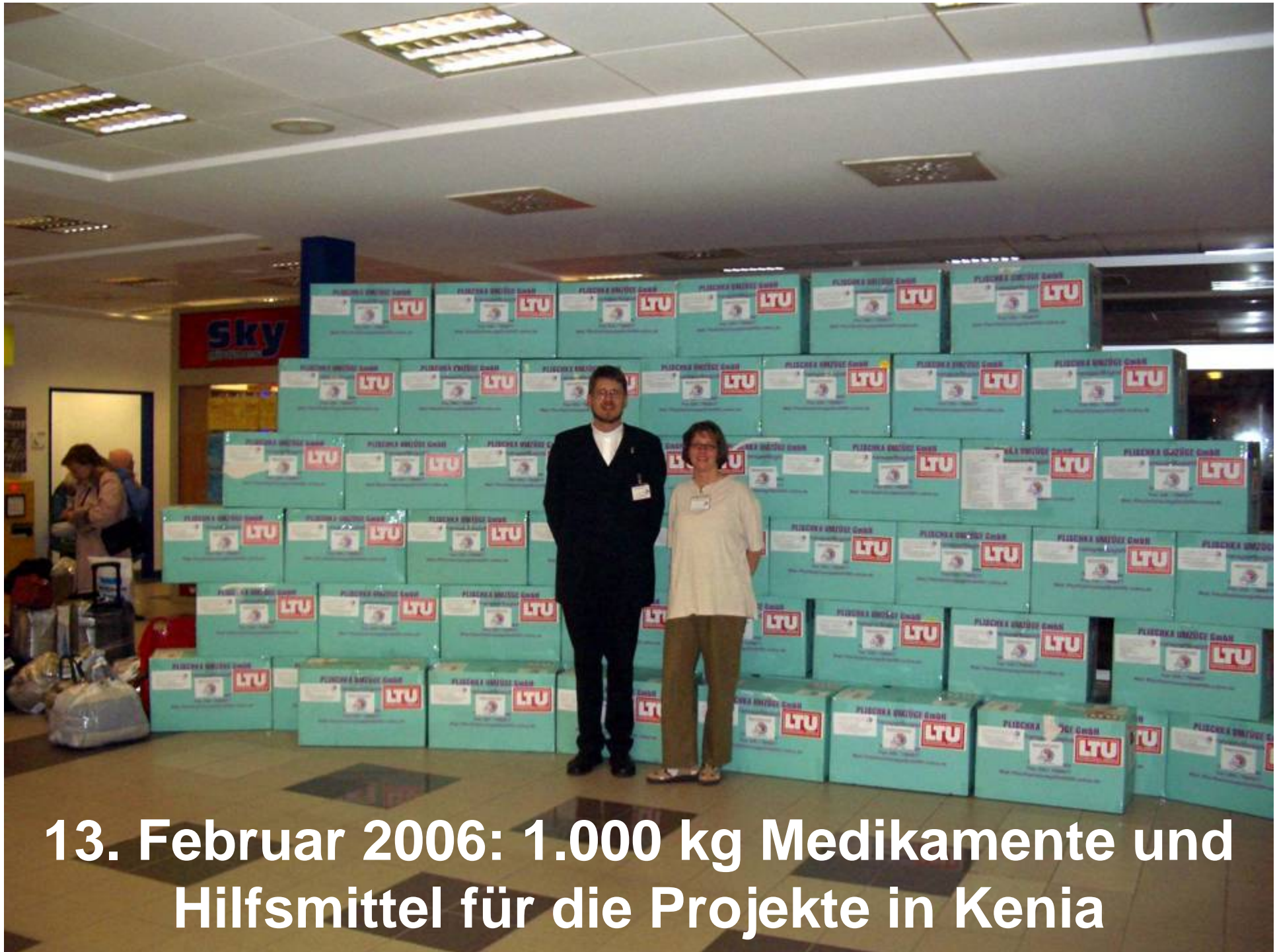
13. Februar 2006: 1.000 kg Medikamente und Hilfsmittel für die Projekte in Kenia